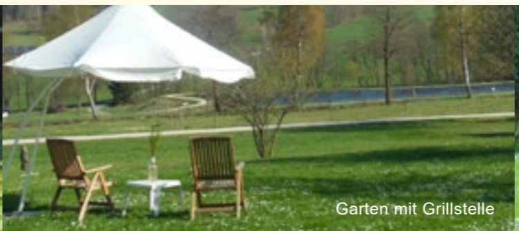
Garten mit Grillstelle